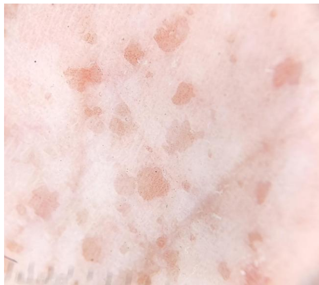
Imagen N°2. Pits o fosas palmares. Se visualizan pits palmares bajo dermatoscopia, depresiones circulares/ovaladas asimétricas, de color rosadas y rojas, que miden entre 1 a 3 mm de diámetro y profundidad. Uso concedido mediante consentimiento informado.