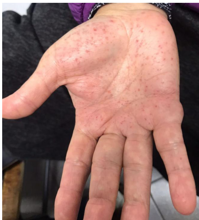
Imagen N°1. Pits o fosas palmares. Se observa una vista macroscópica palmar de la paciente, visualizándose pits palmares difusos. Uso concedido mediante consentimiento informado.

Desde su diagnóstico se ha mantenido en seguimiento con controles mensuales por parte de la especialidad de Dermatología donde se ha realizado la biopsia de más de 40 lesiones compatibles con CBC hasta la actualidad evolucionando en óptimas condiciones, buena adherencia al tratamiento no farmacológico y consulta oportuna en caso de aparición de nuevas lesiones.